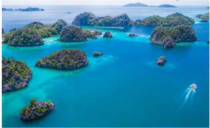
Papua Paradise Resort