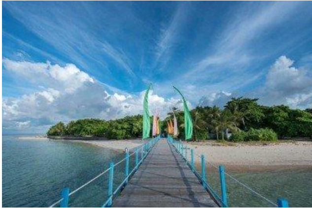
Gangga Island Resort